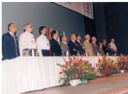
XXII Congreso de la Sociedad Internacional de Técnicos de la Caña de Azúcar, ISSCT. Colombia 1995.

Estudios hechos sobre la manera como las innovaciones se difunden en las grandes organizaciones señalan una y otra vez la importancia de las redes formales e informales de intercomunicación y la importancia de las comunidades de profesionales para conseguir objetivos comunes.