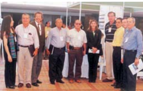
V Congreso de Tecnicaña, 2000.