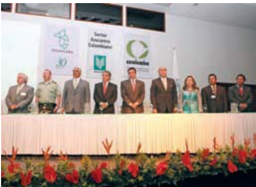
Mesa de honor con invitados especiales. Acto de apertura de la XXXIV Asamblea Extraordinaria de Tecnicaña.

Tecnicaña recibió dos condecoraciones otorgadas por la Gobernación