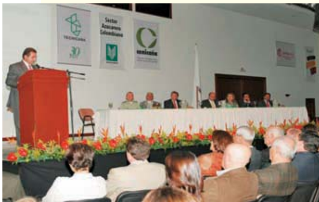
El doctor Bernardo Moreno Villegas, secretario general de la Presidencia de la República, fue el encargado de transmitir el mensaje del primer mandatario a la Asamblea de Tecnicaña.

Plantear una política social en un país donde no avanza la inversión, donde no hay seguridad, donde no afluyen los recursos, es plantear un salto a la demagogia; es proponer una política social inocua, una política social atractiva en campañas electorales y totalmente frustrante en resultados de gobierno.