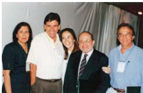
VI Congreso de Tecnicaña, 2003.