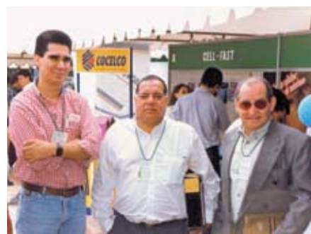
IV Congreso de Tecnicaña, 1997.