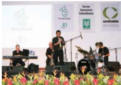
Pioneros del Ritmo y Grupo de Jazz.