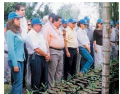
II Congreso de Macadamia, 2004.