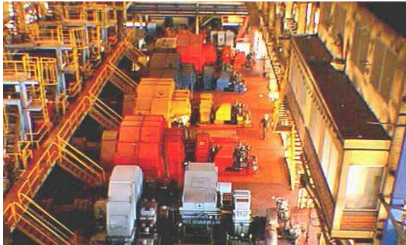
Figura 2. Molinos con Turbinas.

el suministro exacto del combustible y el aire necesario para la combustión del mismo, alcanzando la relación óptima de aire/combustible que permitirá disminuir en un 50% el consumo de carbón, lo que es muy favorable para la preservación del medio ambiente y es valorado por el protocolo de Kyoto, el cual a través de transacciones de bonos verdes equivalentes a la disminución de emisión de toneladas de CO_2 a la atmósfera representan un gran apoyo económico y viabilidad a la ejecución de estas obras.