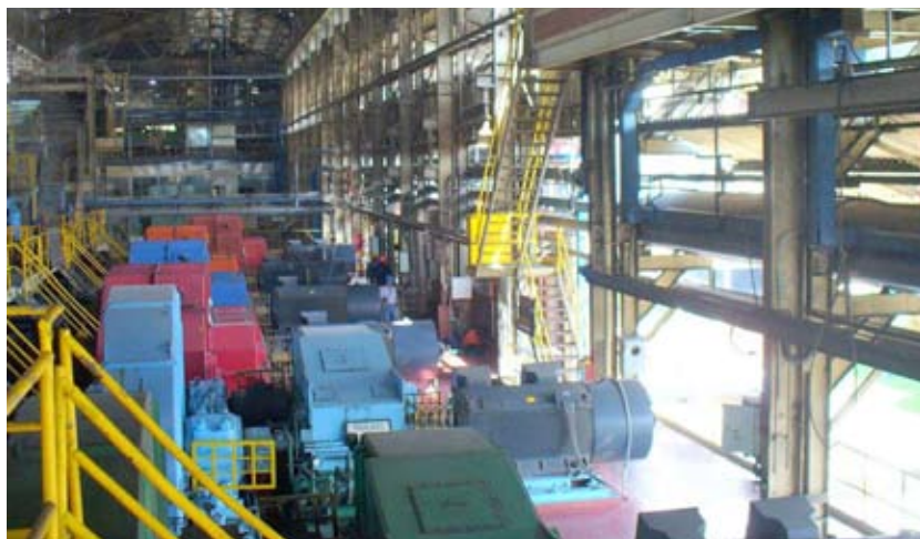
Figura 3. Molinos con Motores Eléctricos.